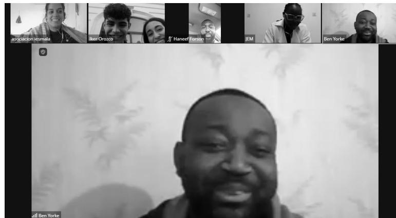
Momento de una reunión de coordinación de proyectos de IESMALA