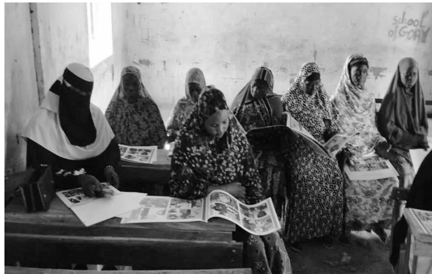
Beneficiarias del proyecto SAAL

El proyecto forma a 500 mujeres en 10 temas de interés para la salud individual, familiar y comunitaria (malnutrición infantil, diabetes, hipertensión, parásitos intestinales, infecciones respiratorias agudas, infecciones urinarias, infecciones de transmisión sexual, reproducción, malaria y tuberculosis).