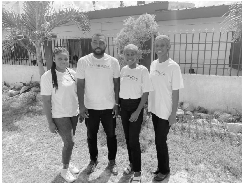
Colaboradores del socio ghanés

Esta ONG, activa desde 2012 y dedicada al desarrollo local por medio del voluntariado ghanés, abre sus puertas a la experiencia transcultural que surge de este programa.