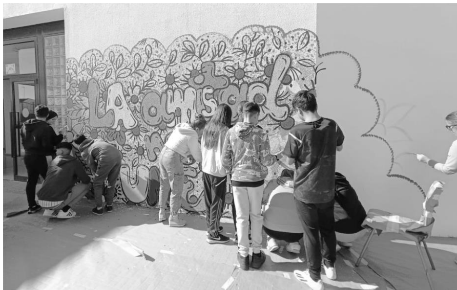
Alumnado del taller de murallismo transcultural del proyecto SIISER