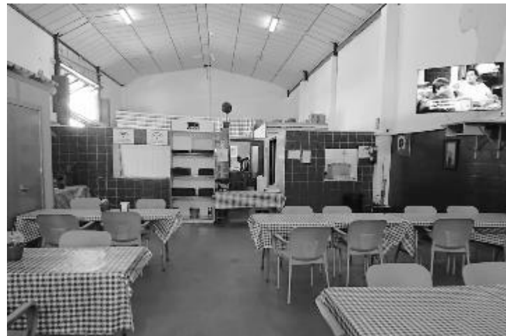
Fotografía del comedor