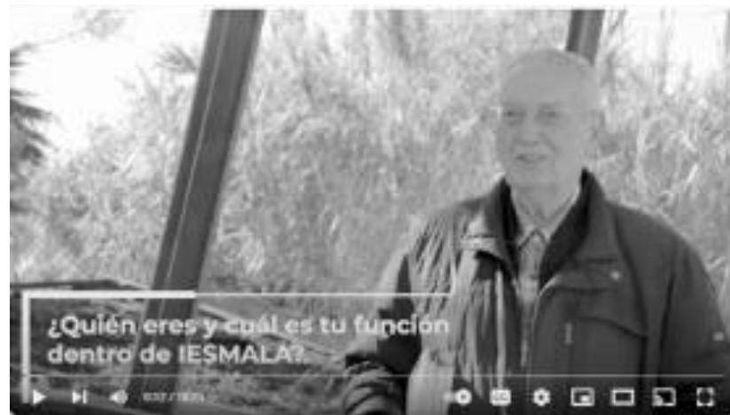
Huelva en Red por la Cooperación: IESMALA

Video Presentación de Huelva en Red Por la Cooperación